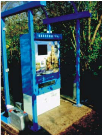
Stadtwerke Schwäbisch Hall