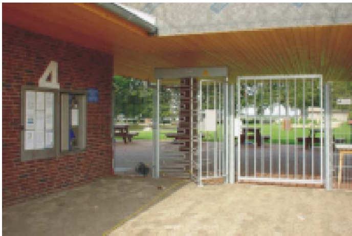
Naturbad Neunkirchen- Vörden