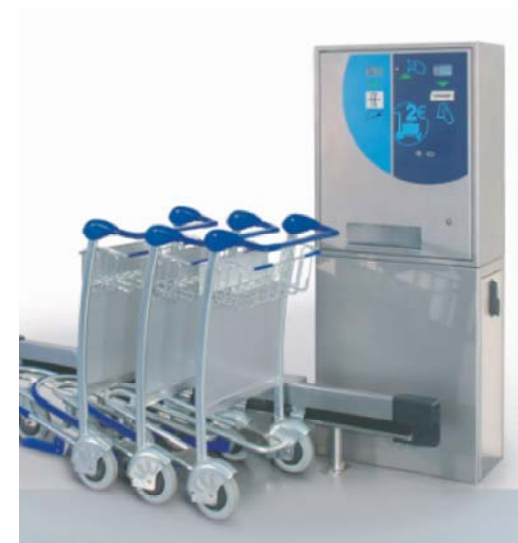
Ausgabestation für Gepäckwagen

Systeme für Freibäder Museen, Toiletten und Freizeitparks