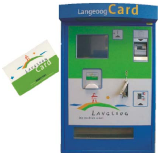
City Card System

Automatische Bezahlstationen für Behörden, Kommunen und Freizeitparks